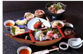
料理長おすすめ和膳イメージ