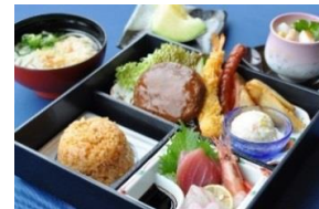
子供定食イメージ