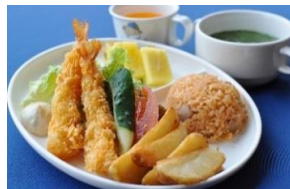
キッズプレートイメージ