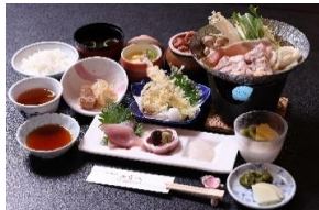
量控えめ和膳イメージ