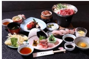
スタンダード和膳イメージ