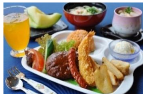
お子様ランチイメージ